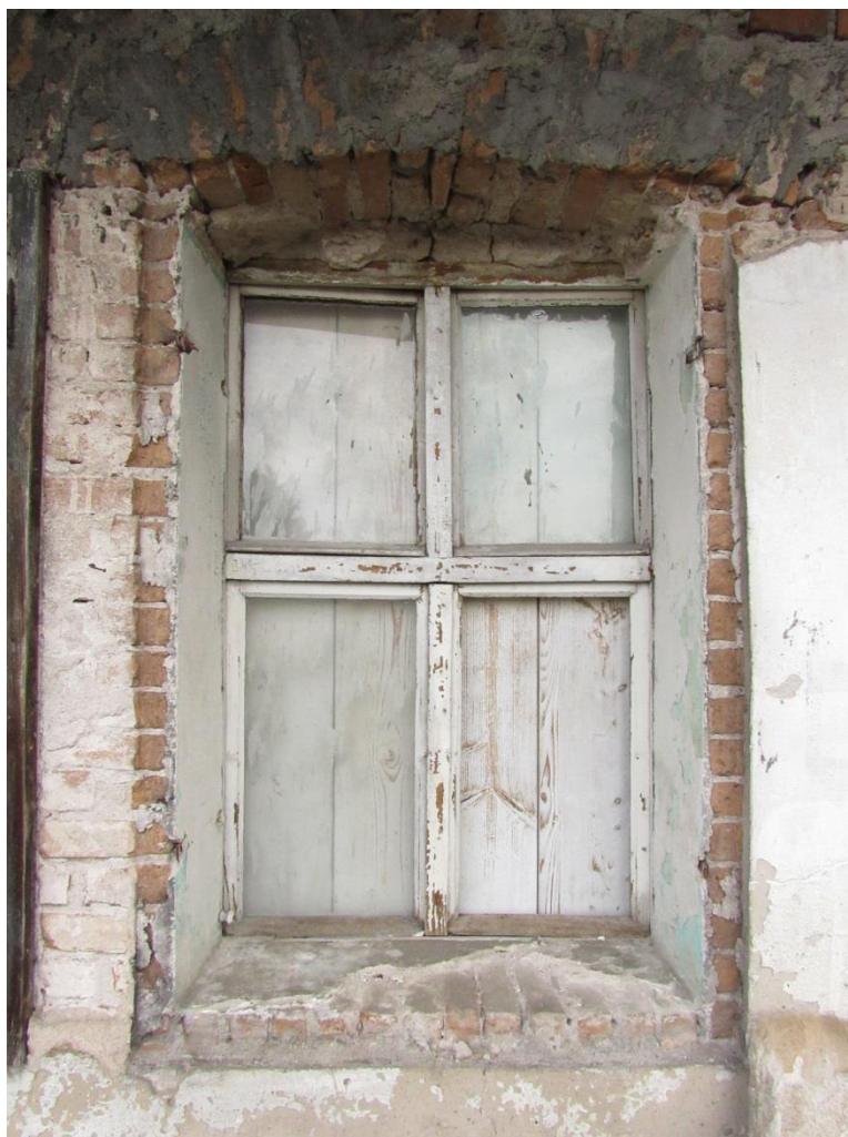
Pohled z vnější strany