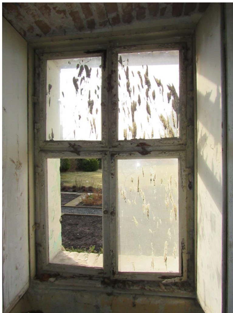
Pohled z vnitřní strany