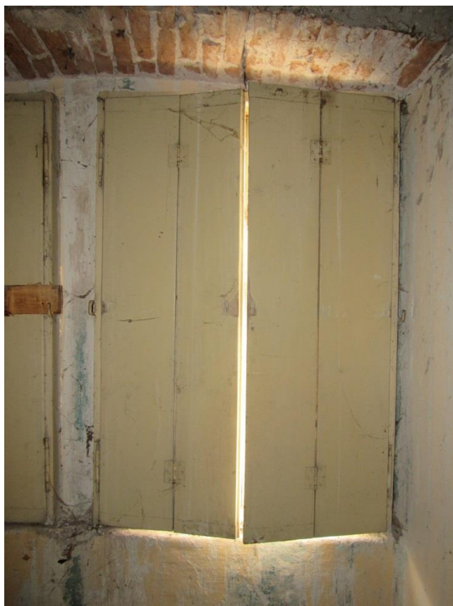
Okenice okna F17, chybějící závora