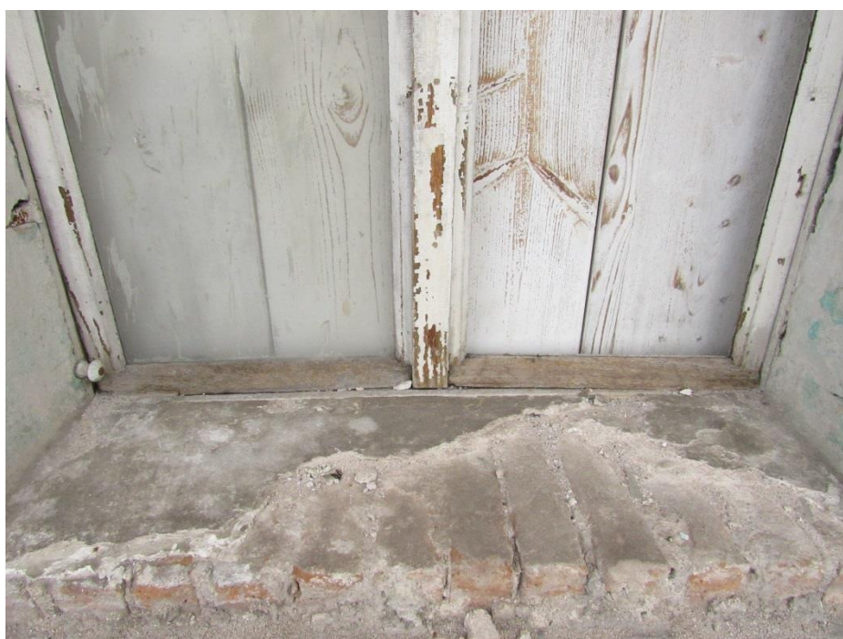
Detail spodní části vnitřního okna