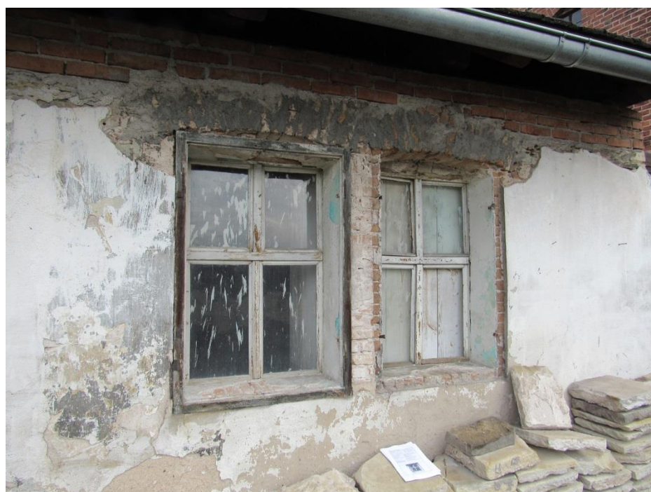
Celkový pohled na okna F17 a F17b