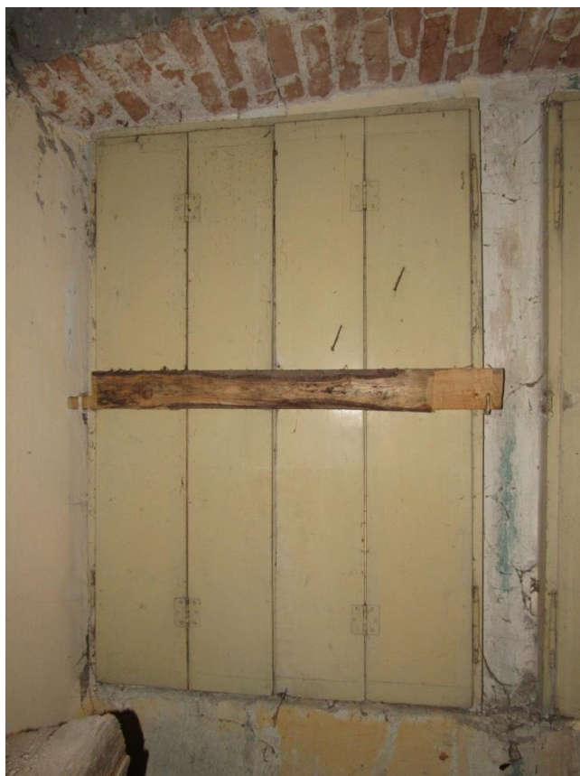
Okenice okna F17b, nepůvodní závora