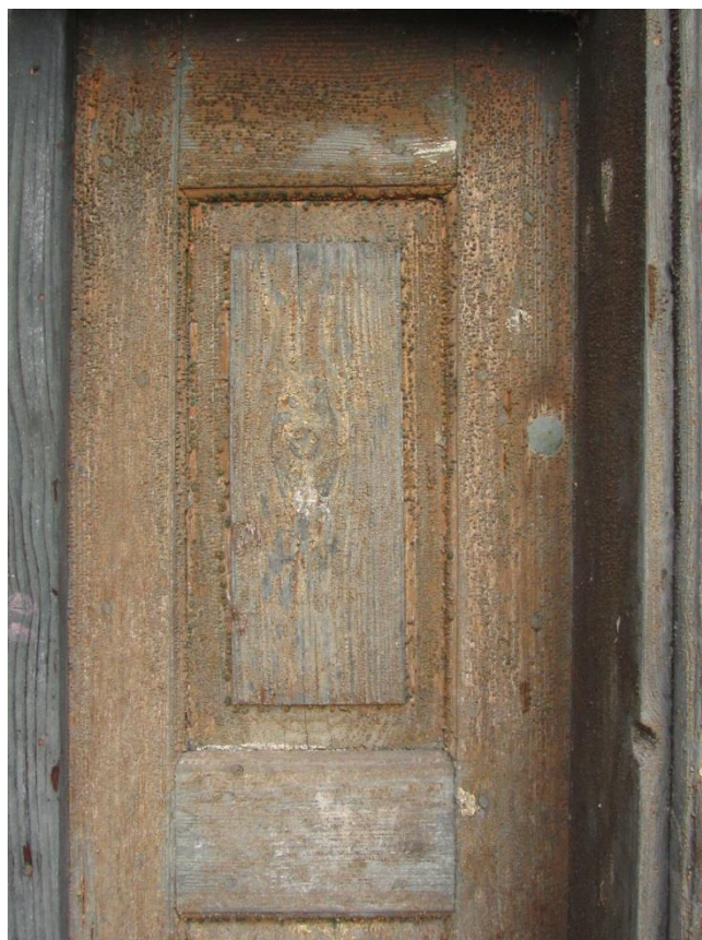
Degradovaná povrchová úprava