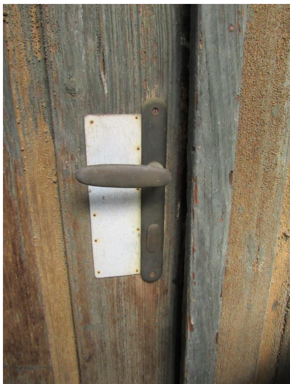
Klika vnější strana