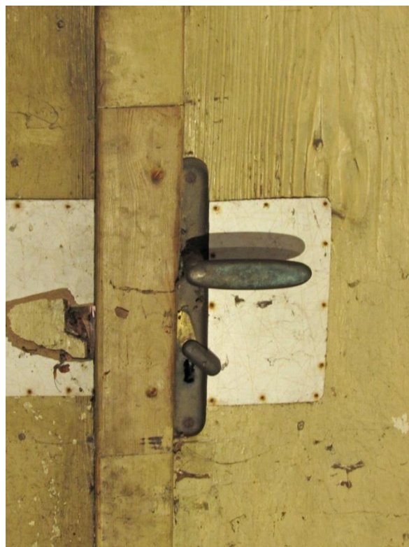
Klika vnitřní strana