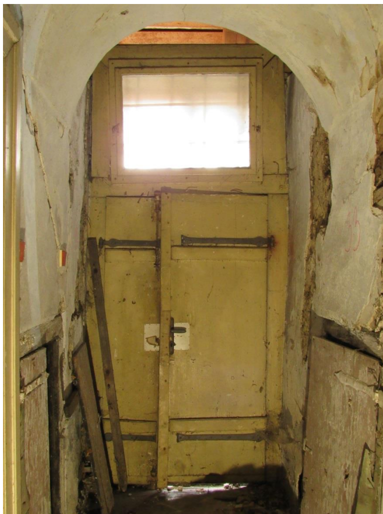
Vnitřní strana dveří