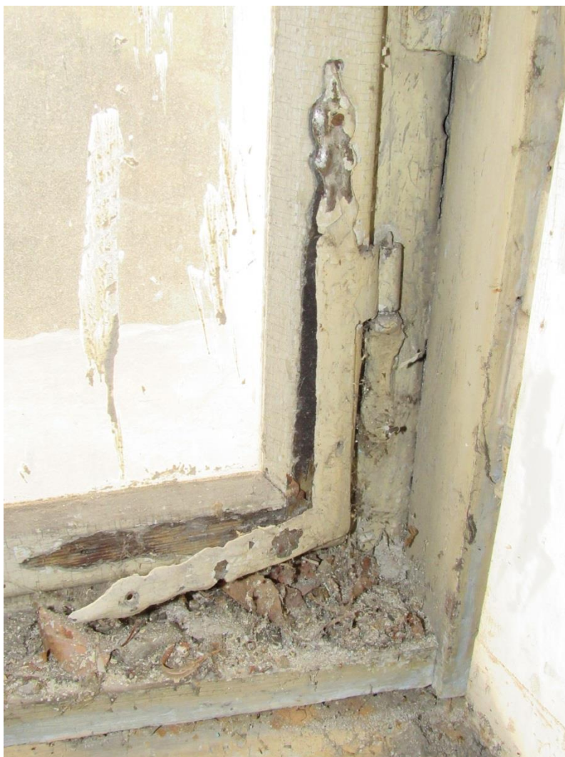
Uvolněná rohová výztuž