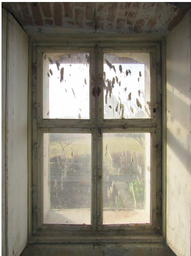
Pohled z vnitřní strany