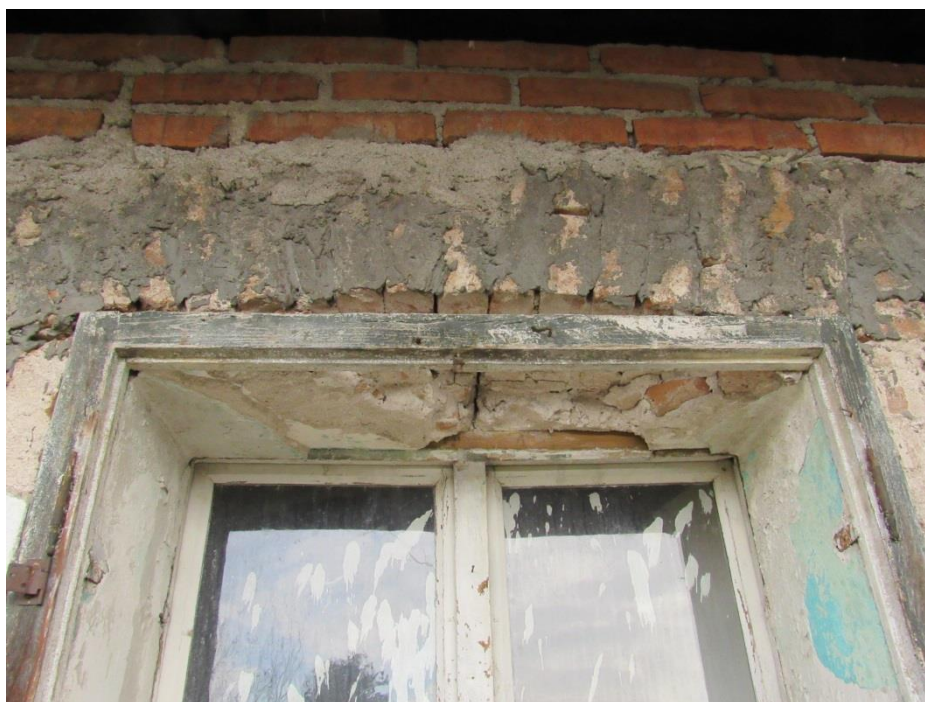
Detail rámu vnějšího okna