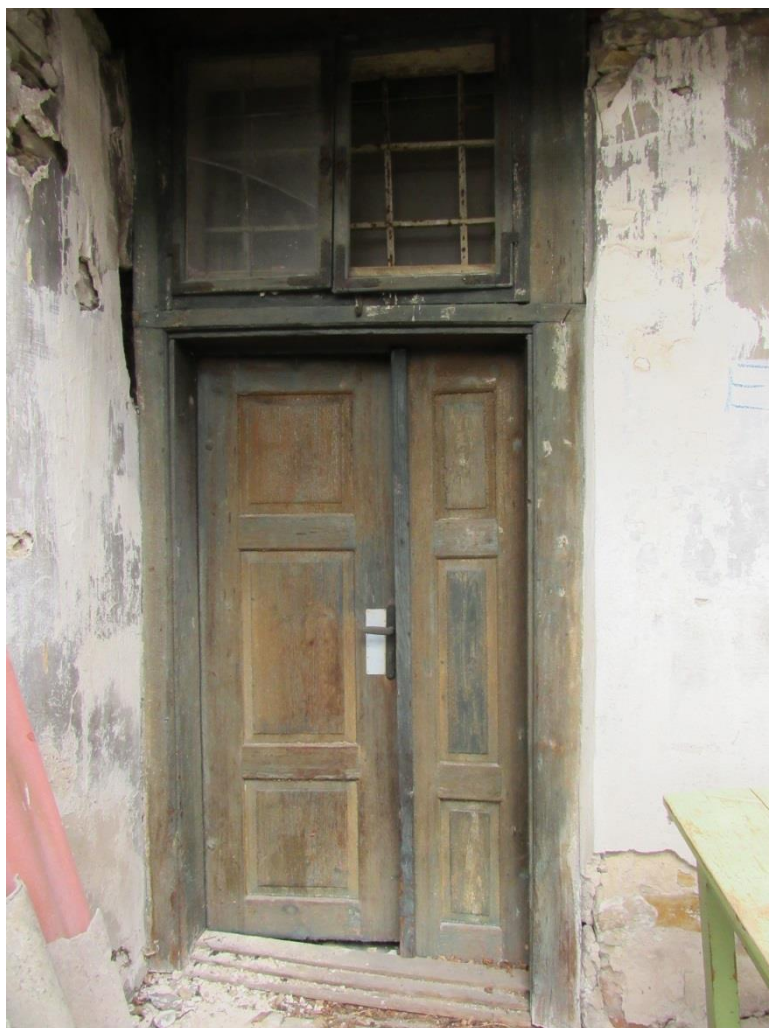
Vnější strana dveří