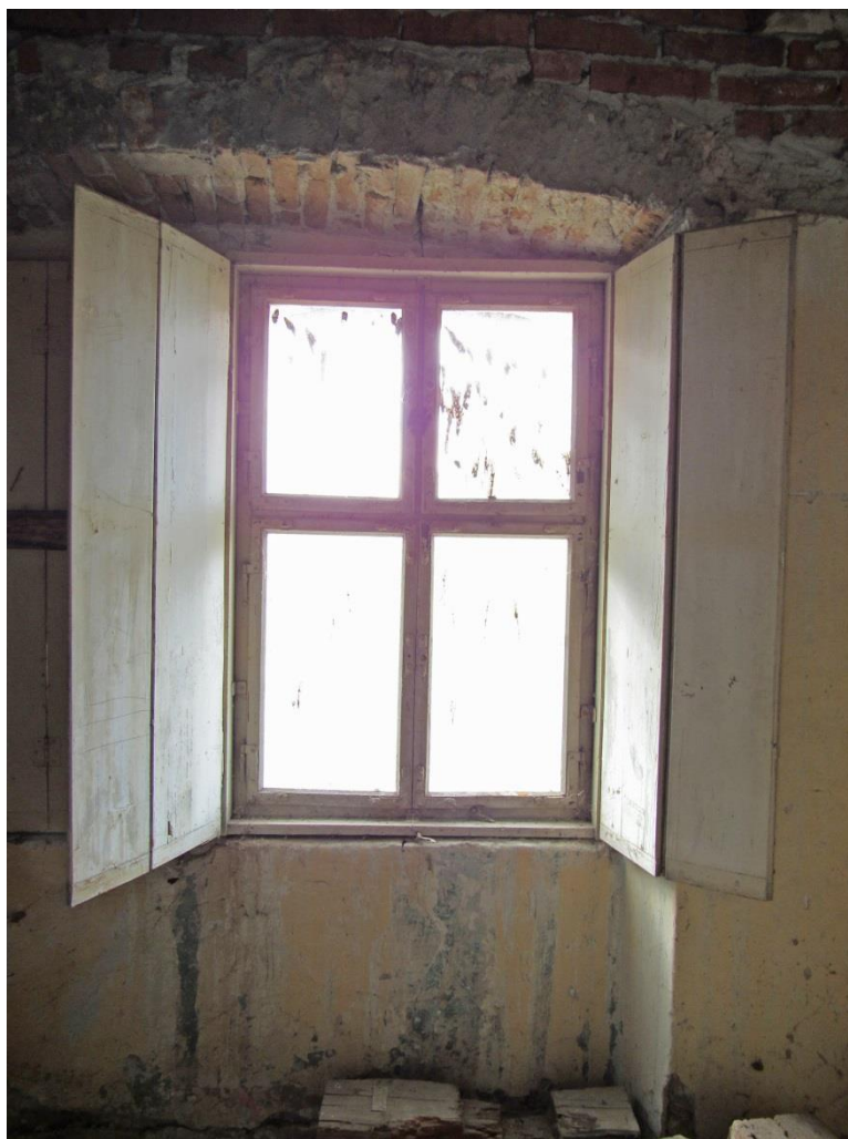
Otevřená okenice okna F17